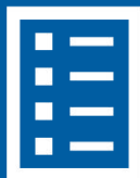
企业所得税弥补亏损明细表 (A106000)